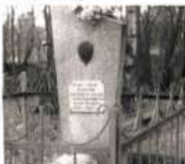
5. Фотографии могилы